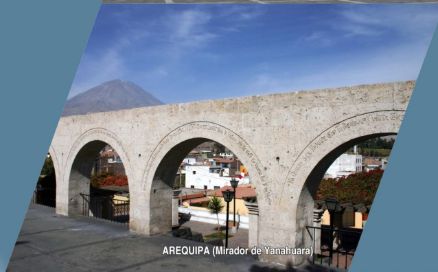
AREQUIPA (Mirador de Yanahuara)