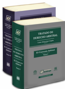
TRATADO DE DERECHO ARBITRAL "El Convenio Arbitral" Tomo I y II