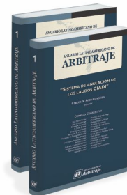
ANUARIO LATINOAMERICANO DE ARBITRAJE N° 1 "Sistema de Anulación de los Laudos CIADI"