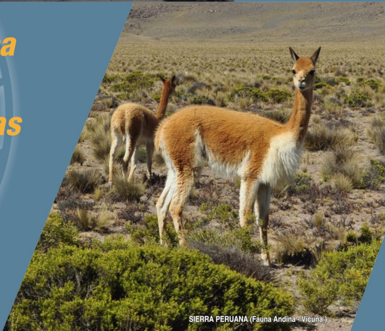
SIERRA PERUANA (Fauna Andina - Vicuña)