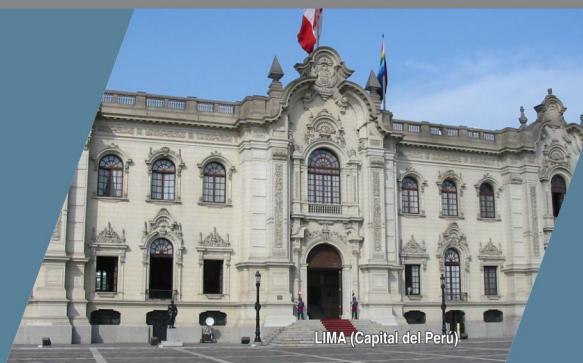
LIMA (Capital del Perú)