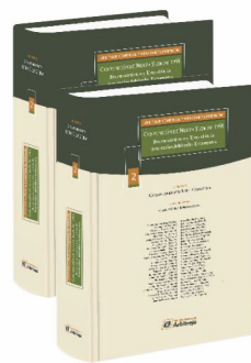
"LA CONVENCION DE NUEVA YORK DE 1958"